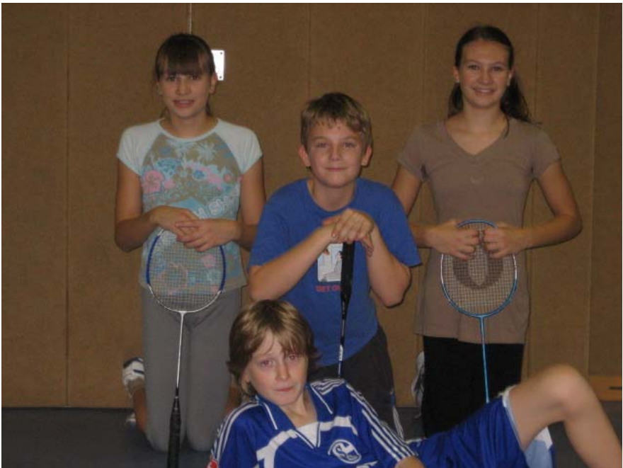
Bild der Minimannschaft Saison 2008 /2009

Ausgestattet mit Trikots von unserem Sponsor Reifen Wüsthoff und der Aufschrift SG Zons Badminton macht unsere Mannschaft auch optisch einen guten Eindruck.