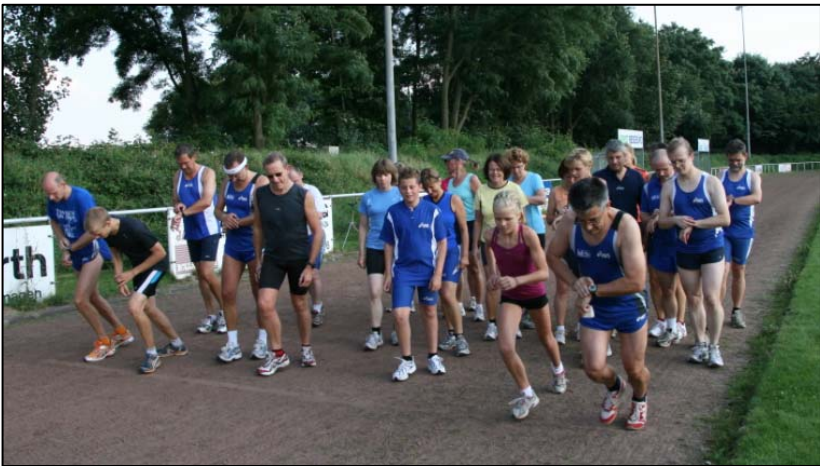
Start über 5000m