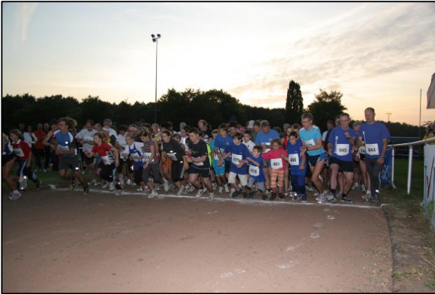
Start zum 12. Jedermannlauf

Sie möchten mehr über das Laufereignis wissen? Dann einfach auf der SG ZONS Homepage unter www.sg-zons.de auf Entdeckungsreise gehen. Dort findet man noch viel mehr Infos.