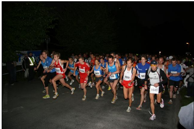
Start des 32. Zonser-Nachlaufs